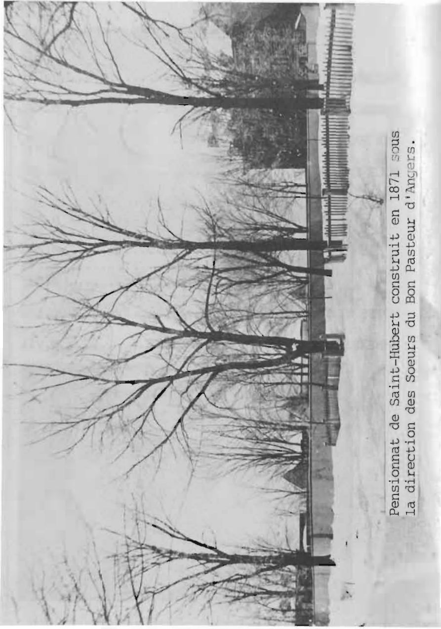
Pensionnat de Saint-Hubert construit en 1871 sous la direction des Soeurs du Bon Pasteur d'Angers.