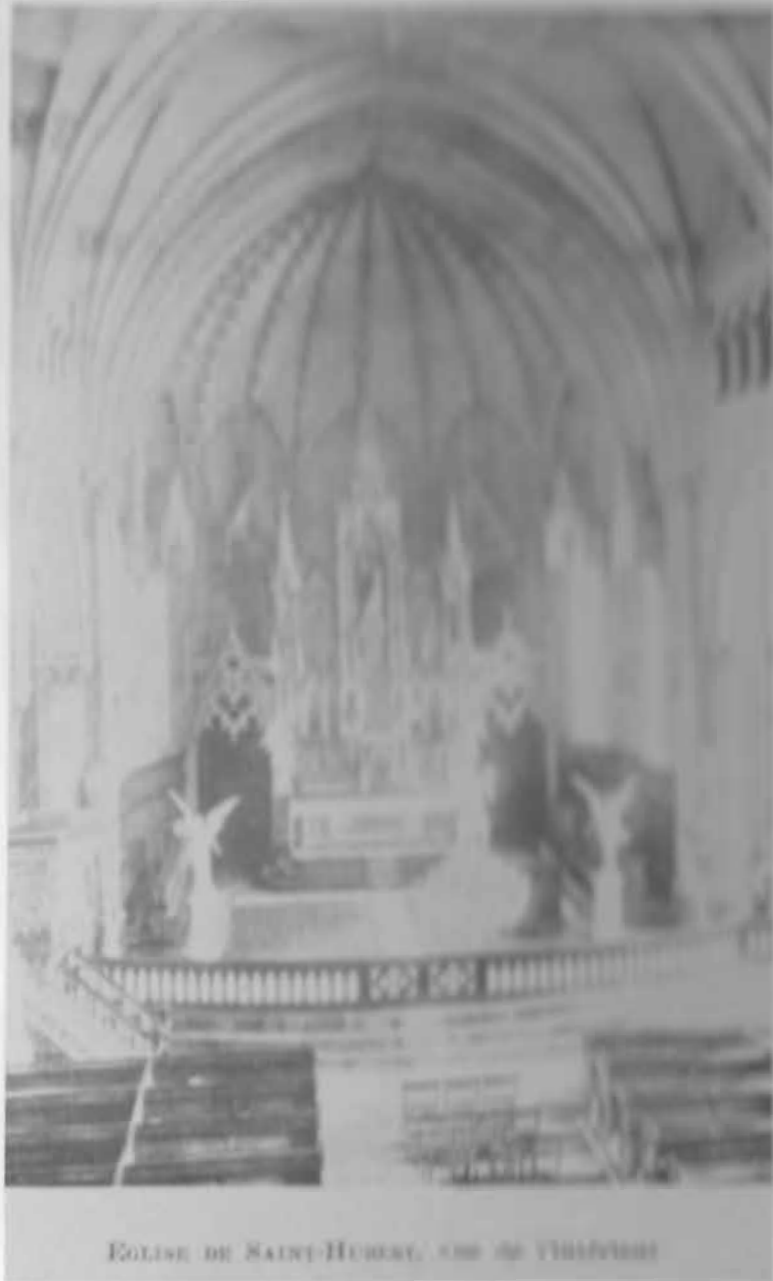
EGLISE DE SAINT-HUBERT, CÔTE DE YTHÉBY

Imprimé à titre gracieux par Pratt & Whitney Canada