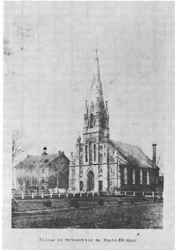
EGLISE ET PENSIONNAT DE SAINT-HUBERT

Cet acte résume ce qui attend les scissionnistes: