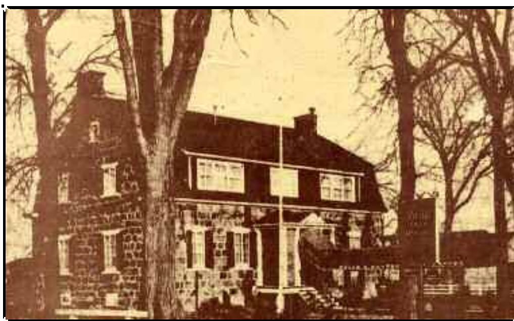
Restaurant l'Ancêtre vers les années 1970